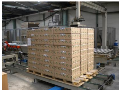
Paketi na koncu Linije za pakiranje izdelkov »LCR«